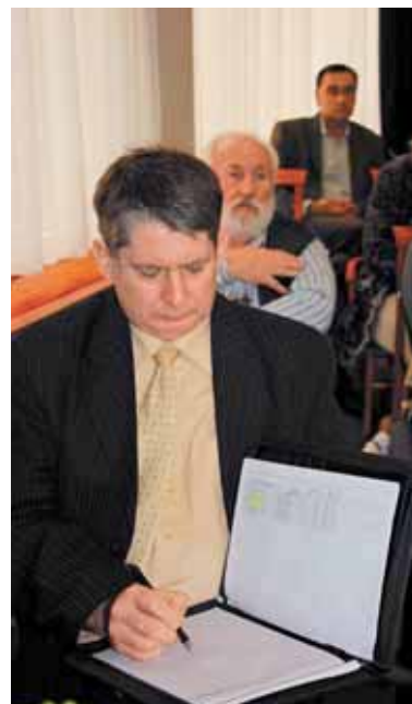
Workshop Sárospatakon – negyven hasonló rendezvényt bonyolított le a BOKIK a projekt keretében

A megyei szakképzési rendszer és a helyi vállalkozások igényeinek összehangolása jelenleg talán a legfontosabb terület a szakképzésben. A Borsod-Abaúj-Zemplén Megyei Kereskedelmi és Iparkamara ezt a célt szem előtt tartva csatlakozott a TÁMOP-2.2.7-B-2-13/1 pályázati kiírás keretében megvalósuló szakmai programhoz.