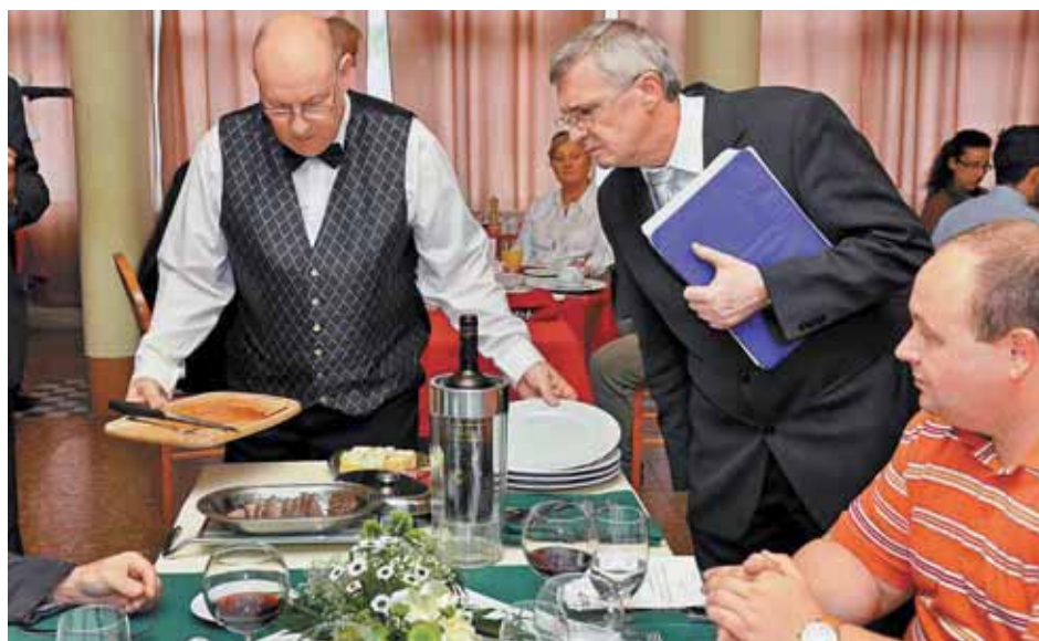
Pincérek mestervizsgálója. Tizennyolc szakmában háromszázötvenen kapnak mesterlevelet

November 19.: Pályaválasztási Kiállítás Tokajban. Helyszín: a Szerencsi Szakképzési Centrum Tokaji Ferenc Gimnáziuma és Szakközépiskolája.