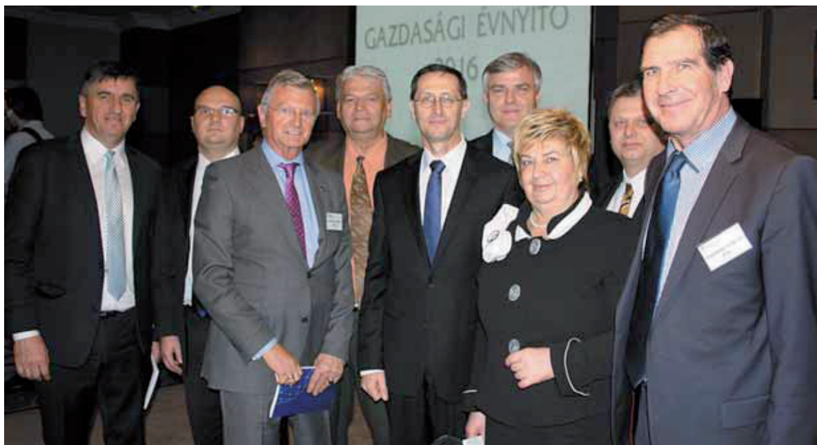
A Borsod-Abaúj-Zemplén megyei résztvevők csoportja Varga Mihály nemzetgazdasági miniszterrel

A közfoglalkoztatási rendszerről szólva felhívta a figyelmet arra: még mindig vannak – körülbelül 200 ezren –, akik a közmunkában sem vesznek részt, noha a magyar költségvetés 2017-ben már képes előállítani azt a forrást, amelyből mindenkinek munkát tudnának adni. Ezért azoknak, akiknek az állapota nem engedi meg, hogy a jelenlegi közfoglalkoztatásban részt vegyenek, új foglalkoztatási formát kell bevezetni még kisebb követelményekkel – szorgalmazta. A közmunkaprogram másodlagos hozadékai közé sorolta, hogy kevesebben követnek el bűncselekményt, kevesebben vannak börtönben, és a gyermekek is másképpen nevelődnek, ha azt látják, hogy a szülő reggel elmegy dolgozni. Orbán Viktor közölte azt is, hogy a kormány úgy határozott: új döntési rendszert vezet be az uniós pályázatoknál. Ennek értelmében a korábban kiszervezett pályázati döntési rendszert megszüntetik, és – önkéntes jelentkezés alapján, plusz fizetésért – felállítanak egy, az államigazgatásban dolgozókból álló, nyilvános pályázatbíráló szaknév-