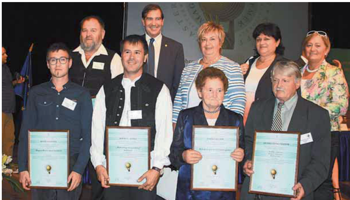
A Borsod-Abaúj-Zemplén megyei nyertesek a kamara munkatársaival

féműves pályamunkája Miskolcra – Magyar Rózsa ékszer kollektív címmel. Az ötös mesterség egyik olyan remekét üdvözölhetjük, amely a mai kor igényeinek megfelelően, új formákat keresve, gazdagító hatással van a nézőre. Nagyon szép ékszer kollektív.