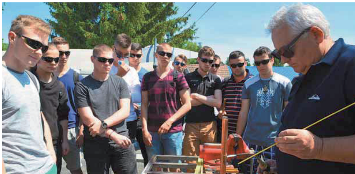
A fiatalok figyelmét rá kell irányítani az egyes szakmák szépségeire és a szakmatanulás fontosságára. A fotó Illusztráció!

4. A folyamatosan változó piaci környezetben a Szolgáltatási Tagozat feladata, hogy működésével, szolgáltatásaival megfeleljen a vállalkozások elvárásainak, igazodjon a gazdasági környezethez és a nemzetközi tendenciákhoz. Alkalmazkodó szervezet helyett változtató szervezetként szükséges működni. Olyan tagozatként, amely irányítja a körülötte zajló folyamatokat, ahol az értékteremtés a mozgatórugó.