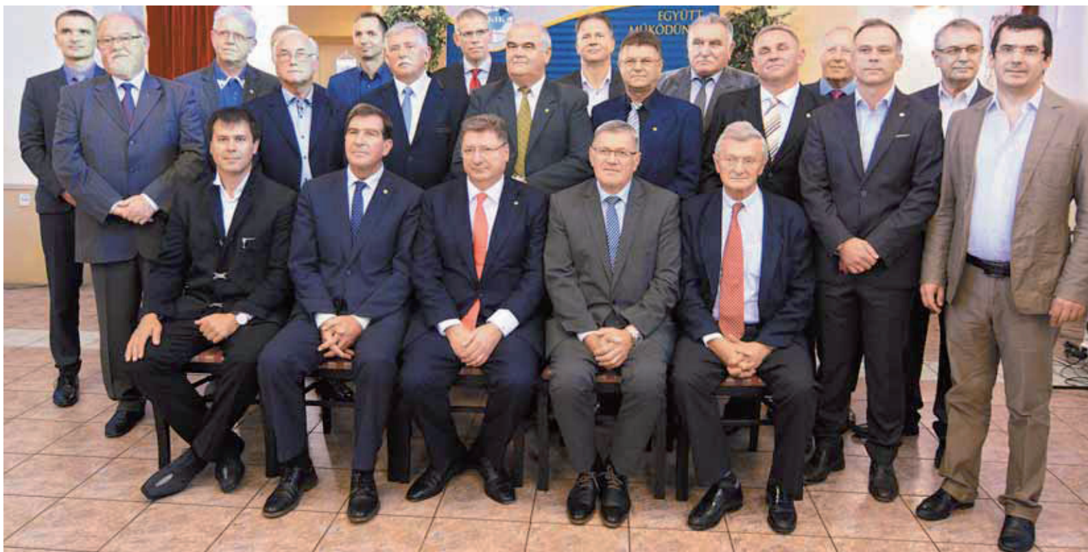
Új elnökség irányítja a kamara munkáját

bereknek, hogy ha itt maradnak, akkor adott esetben ugyanazokat a célokat, életfeltételeket el tudják érni, mint Magyarország nyugati részén, vagy külföldön. Fontos figyelni arra is, hogy a brexit után vélhetően egyre többen fognak a visszatelepülés gondolatával foglalkozni. Ehhez persze fizetésemelés kell, termelékenység-javítás kell, de összességében ezt a kérdést meg kell oldani, mert ez a magyar vállalatok versenyképességét döntően – sajnos negatívan – befolyásolhatja egészen rövidtávon.