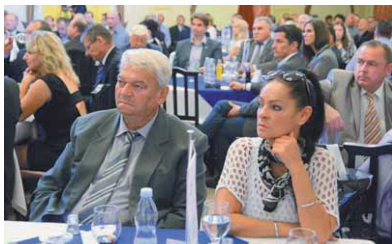
Megtelt a Népkeri Vigadó szeptember 30-án a BOKIK-küldötttel

Az elmondottak mellett évek óta arra törekszünk, hogy bővítsük szolgáltatási rendszerünket. Itt nem csak az önkéntes kamarai tagokra, hanem a több mint 30 ezres regisztrált vállalkozásra is gondolok. El kell érni, hogy a célcsoportok számára fontos szolgáltatásokat közvetítsük, és el kell jutnunk odáig – akár jelentős informatikai fejlesztéssel –, hogy ezeket a szolgáltatásokat célirányosan tudjuk közvetíteni a szakmák számára. És igen, a 2016–2020 közötti időszak kapcsán még két területről beszélnünk kell. Az egyik, hogy folyamatosan szeretnénk megszólítani a fiatal vállalkozókat. Ez nem egyszerű, mert a statisztikák azt mutatják, hogy a 40 év alatti vállalkozók száma, aránya rendkívül csekély. Nyilván meg kell találni azokat a fiatalokat, akik vállalkozásuk saját vállalkozásuk menedzselésén túl a közösségért való tenni akarást is. Azt gondolom, ha a kamara megmutatja nekik ezeket a lehetőségeket, feladatokat, szívesen vállalkoznak arra, hogy bekapcsolódjanak ebbe a munkába. Ami pedig a kamarai infrastruktúra javítását illeti, a miskolci székház energetikai és épületkorszerűsítése áll a lista élén.