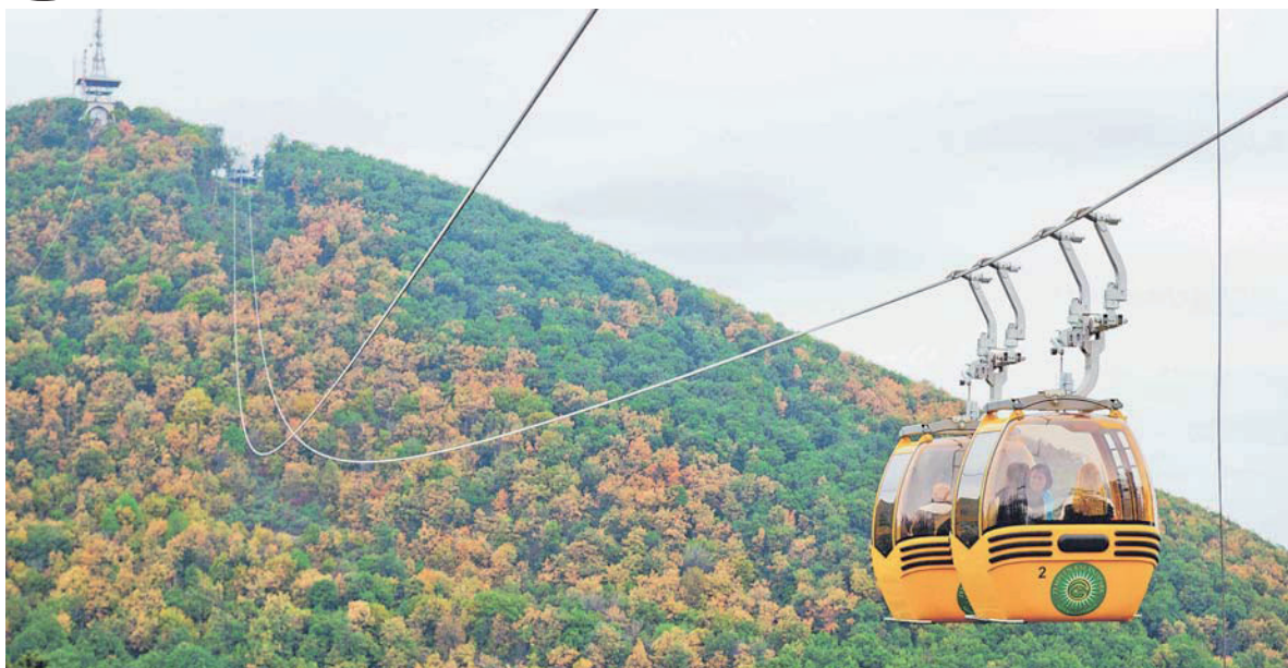
A Zemplén Kalandpark folyamatosan bővülő attrakciói egyre több turistát vonzanak a térségbe