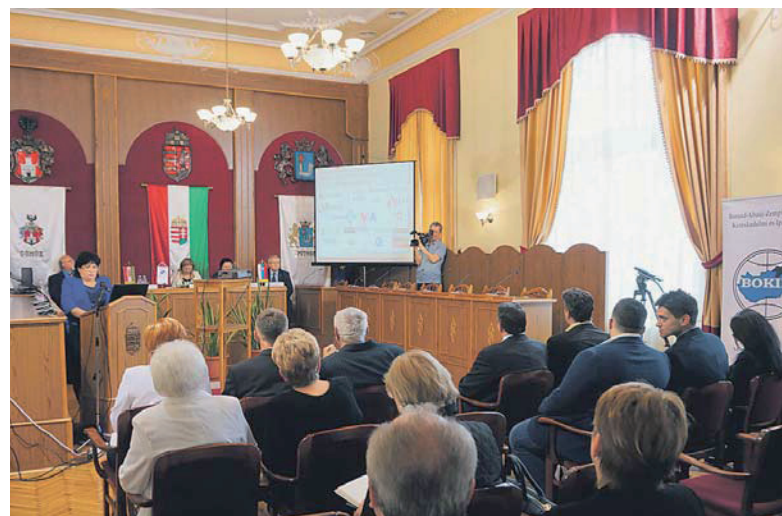
A kamara és Putnok városa közösen szervezte a vállalkozók üzleti találkozóját

A nagy érdeklődéssel kísért tanácskozás résztvevői egyetértettek abban,