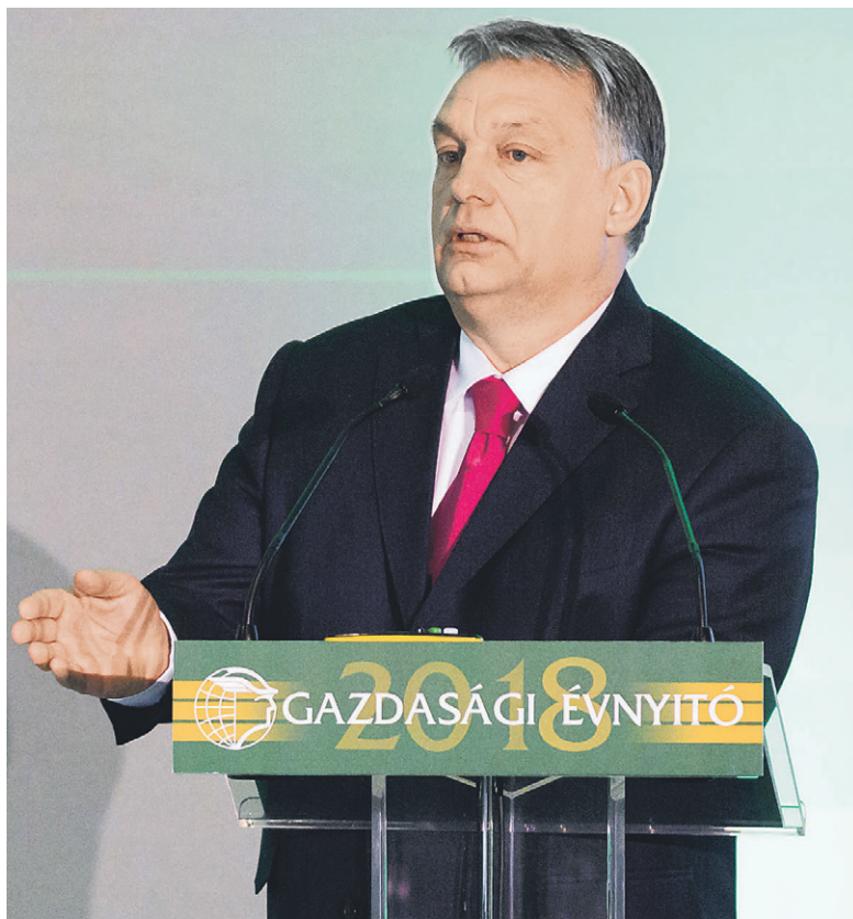
Orbán Viktor: A magyar modell négy pillére a versenyképesség, a munkaalapú gazdaság, a demográfiai és az identitáspolitika

Jelezte, az EU új migránsszabályozási javaslata alapján Magyarországnak több mint 10 ezer embert kellene befogadnia, és a családegyesítést is beleszámolva – 20 ezer emberrel kalkulálva – ez évi 90 milliárd forintos költséget jelentene az országnak. Orbán Viktor hangsúlyozta: Magyar-