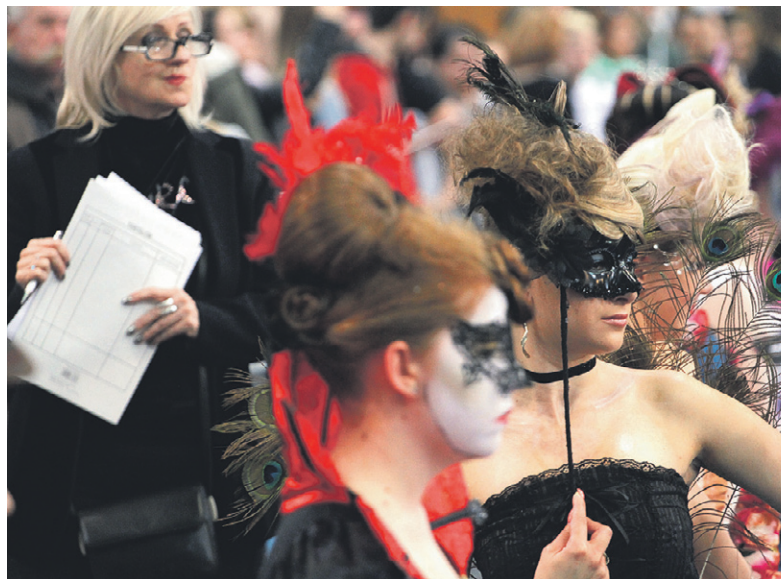
Az utánpótlás-nevelés fontos része a megmérettetés

„Büszkék vagyunk erre a több ezer embert megmozgató rangos kamarai rendezvényre, amely mára már