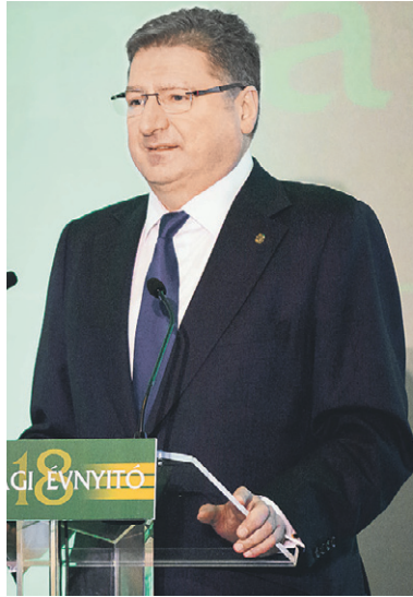
Parragh László, Matolcsy György és Varga Mihály is előadást tartott a rendezvényen

Matolcsy György jegybankelnök előadásában azt elemelte, hogy a következő években az országnak felzárkózási fordulatra van szüksége, meg kell valósítani, hogy 2030-ra az ország fejlettségi szintje elérje az európai uniós átlagot, 2050-re pedig az akkori osztrák fejlettségi szintet. Az MNB elnöke szerint 2010 óta az ország tizenkét sikeres fordulatot hajtott végre, köztük gazdaságpolitikai, monetáris politikai és munkaerő-piaci fordulatot. Kiemelte: a monetáris politikai fordulat révén jelentősen csökkent az országban a kamatok mértéke, az állampapírok hozamszintje, ennek hatásaként a központi