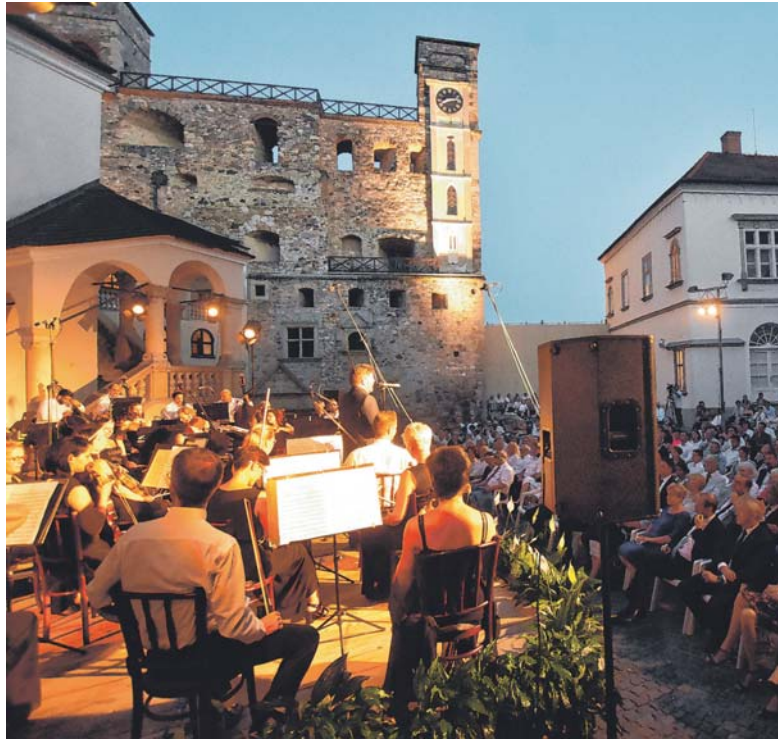
Szükség lenne a megyei attrakciók egységes kiajánlására

Miskolc sok új látnivalót kínál, olyan attrakciókat, amelyek megfelelően vonzóak, és a városnak jó a marketingje is. De a megye egészét tekintve a marketing területén még akad tenivaló. Az egyes turisztikai célpontok – így a történelmi városok, mint Sárospatak, Sátoraljaújhely, Szencs, vagy a mezőkövesdi, bogácsi, tiszaujvárosi gyógyfürdők, illetve a megújult kastélyok, várak – igyekeznek önállóan bemutatkozni a nagyközönség előtt, de hiányzik a megyét egységesen képviselő, megmutató marketing. Pedig ez az összehangolt kiajánlás lehet az egyik módja annak, hogy belföldön és külföldön is jobban felfigyeljenek értékeinkre, és a még kihasználatlan kapacitásainkat lekössük. Bárdos István szerint a másik probléma, hogy a hazánkba érkező külföldiek célpontja – a beutaztató cégek főváros centrikussága miatt –