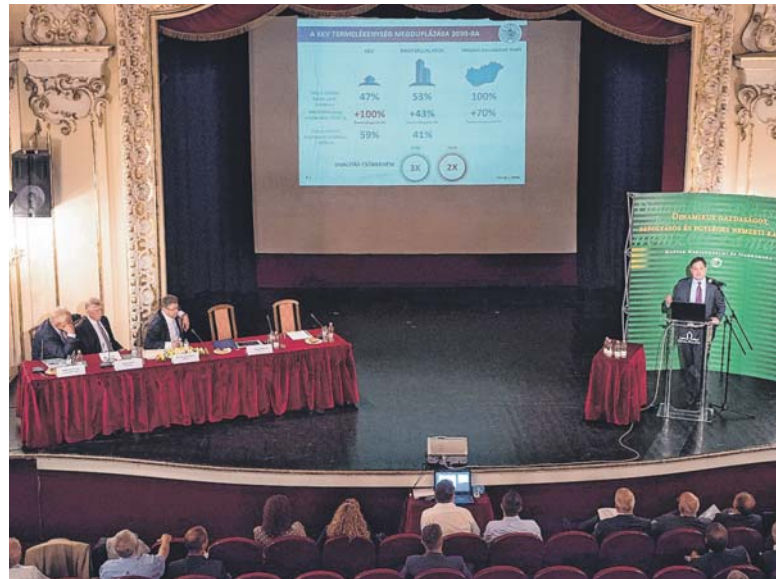
Nagy Márton, az MNB alelnöke is előadást tartott a küldöttgyűlésen

Parragh László szerint a következő években a fenntarthatóságot kell a középpontba helyezni. Szerinte a fenntartható fejlődéshez a gazdaságot segítő hatékony államra, költségvetési fegyelemre, az adóék csökkentésére, a gazdaság fehéritésének a folytatására, a termelékenység növelésére, a szakképzés vonzerejének növelésére, az alternatív foglalkoztatási formák elterjesztésére és a felnőttképzésben részt vevők számának növelésére van szükség. A kamara elnöke hangsúlyozta, a kormánynak oda kell figyelni arra, hogy a magyar kkv-k minél sikeresebben képesek legyenek bekapcsolódni a beszállítói láncokba. A kamara és a kormány négy évente kötött megál-