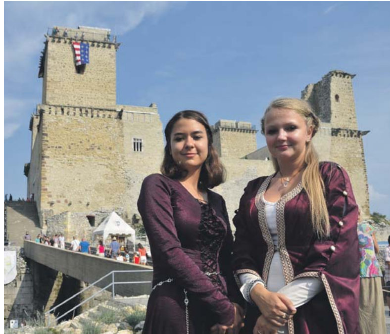
Miskolc a térség motorja kíván lenni. A város meglévő, erős márkáértékkel bíró turisztikai termékei adják a turizmusfejlesztés alapját

A város gazdag turisztikai erőforrásokban, azonban azok csak részben hasznosítottak. Az elmúlt évek keresleti adatai visszaigazolták a város turisztikai potenciálját: a természeti környezet, a kulturális attrakciók, a fürdők turisták százezreit vonzották hozzájuk. A város meglévő, erős márkáértékkel bíró turisztikai termékei adják a turizmusfejlesztés alapját, elsősorban azok tervezett vagy folyamatban lévő tartalmi fejlesztése, szolgáltatásminőség-növelése révén.