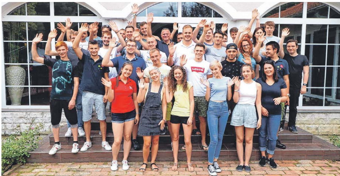
A magyar csapat

• A EuroSkills Budapest 2018 versenyen kiemelkedően ügyes, fiatal szakemberek mérik össze tudásukat és képességeiket Európa számos országából. A szakmák Európa-baj-