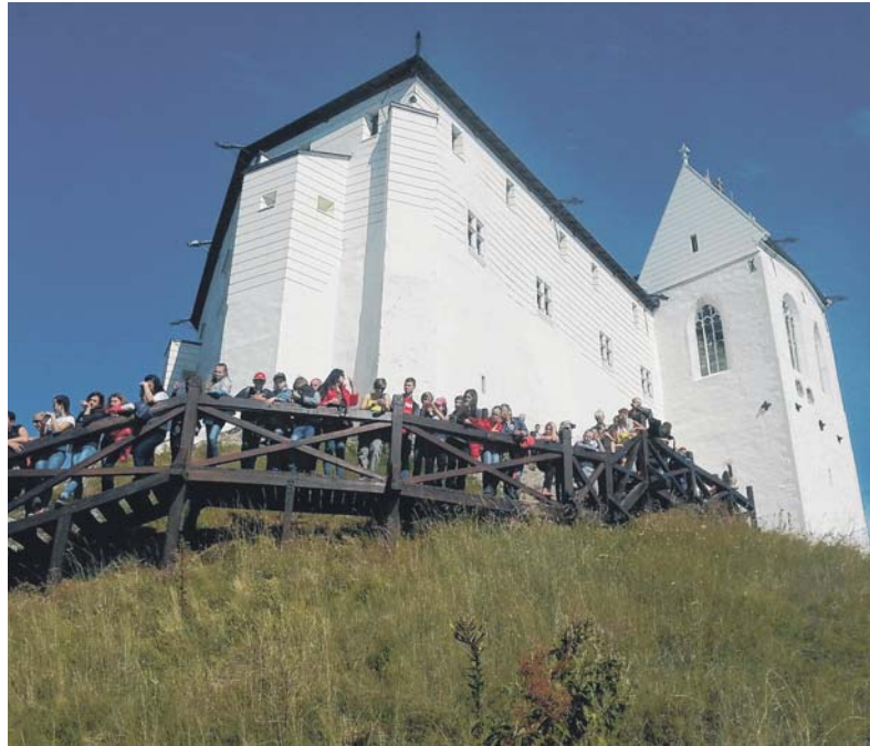
A megújult Füzéri vár sokakat vonz