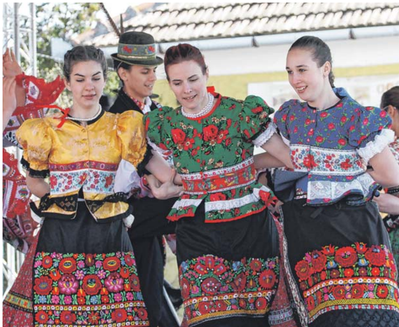
Matyóföldön a hagyományörző programok is kedveltek

A statisztikák szerint a belföldi vendégek látogatják a legnagyobb számban a térségünket, azonban növekedés tapasztalható a szlovák és lengyel vendégek számában is. A bor- és gasztronómiai programok nagy számban vonzották a turistákat a régióba, emellett kiemelendő a kulturális rendezvények (például a Zempléni Fesztivál) turizmus-élénkítő hatása is. A főszezon végén már tapasztalható az érdeklődés az őszi programok és hosszú hétvégék iránt, ennek következtében minden bizonnyal sikeres évet zárnak majd a turisztikai szektorban részt vevő zempléni szolgáltatók és szálláshelyek.