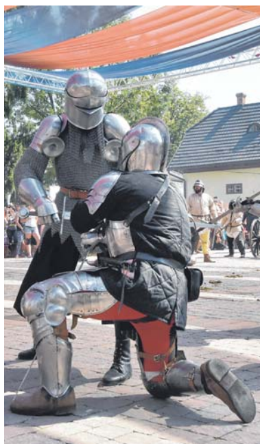
A Diósgyőri vár programjai mindig telt házasak