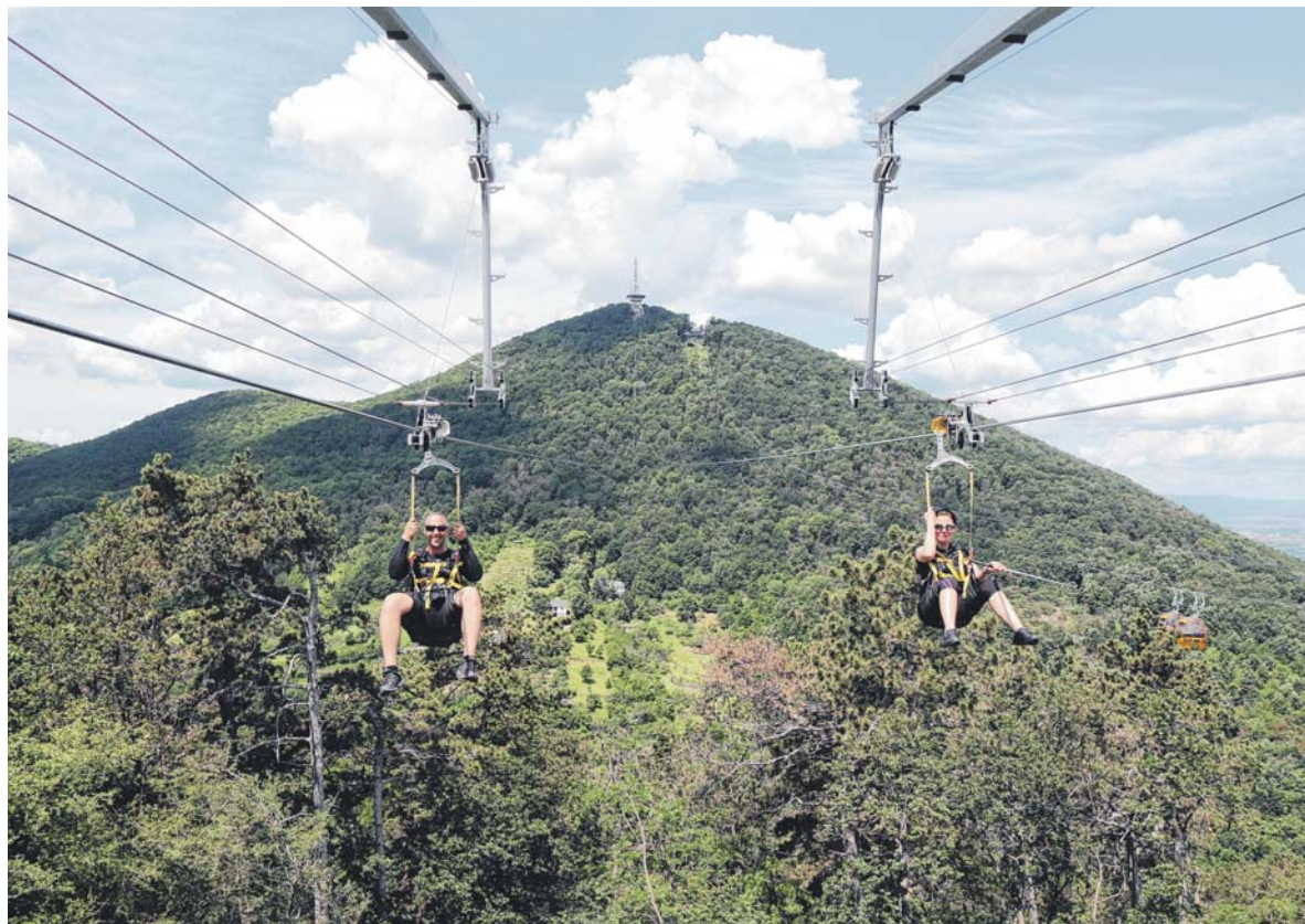
A sátoraljaújhelyi kalandpark a Zemplén egyik kedvenc turisztikai célpontja