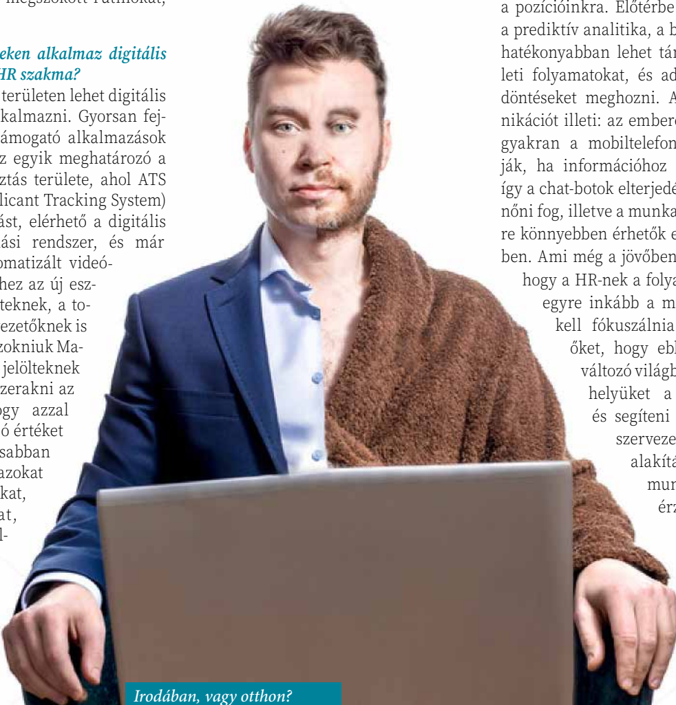
Irodában, vagy otthon?