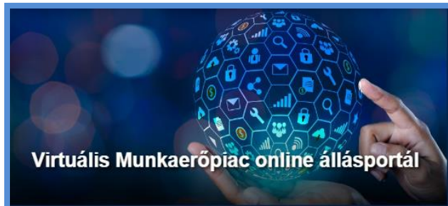
Virtuális Munkaerőpiac online állásportál