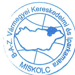
Dudás Tiborné titkár